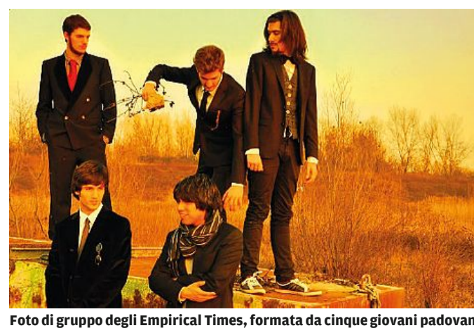
Foto di gruppo degli Empirical Times, formata da cinque giovani padovani

L'anima del gruppo, nato nel 2011, è il genere progressive-rock, quello degli albori di fine anni '60 e l'inizio degli anni '70, rivisitato e svecchiato. I ragazzi, che hanno dai 21 ai 24 anni, propongono musica propria, come sono stati scritti e arrangiati grazie al loro talento i brani che compongono questo primo lavoro, dove hanno scelto di musicare i testi della raccolta "Lucy's Poems" del poeta romantico e naturalista William Wordsworth, che faranno sentire questa sera. Ingresso a offerta libera.